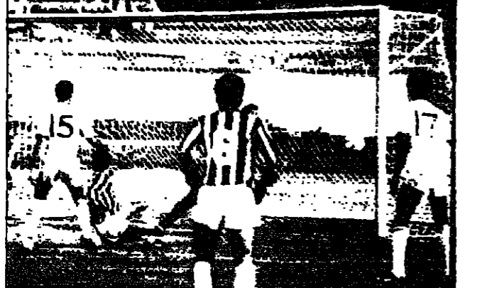
عقبة الخضري - جدة : تشهد مدينة جدة مساء اليوم لقاء عكالي جده الاتحاد والاهلي ضمن مباريات الدور الاول من الدوري الممتاز لكرة القدم ويعتبر هذا اللقاء رقم ٧٤ بينهما فقد التقيا قبل هذا اللقاء ٧٣ مرة ما بين مباريات ودية ورسمية فاز الاهلي في ٢٨ لقاء . وسجل خلالها ١١٠ اهداف . فيما فاز الاتحاد في ٢٢ مباراة وسجل خلالها ١٠٢ هدف . وفيما يلي نتائج لقاءات الفريقين خلال الدوري الممتاز :

فوز الاهلي ٢٨ مرة مقابل ٦ فوزا للاتحاد أكبر نتيجة للفريقين في الدوري الممتاز فوز الاهلي ٢/٥ والتعادل ٤/٤